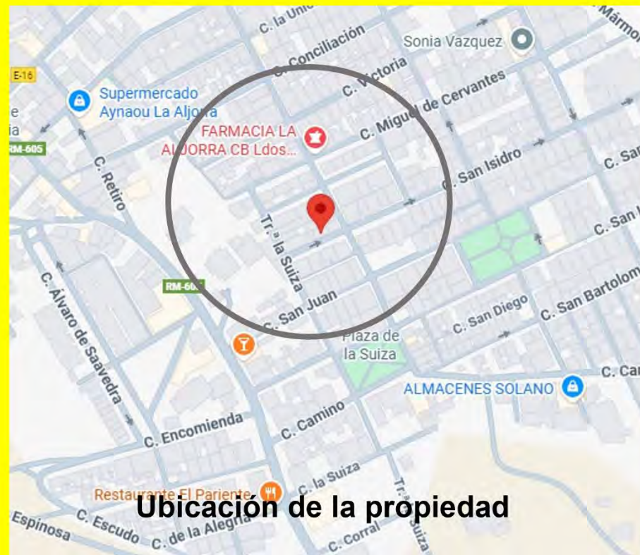
Ubicación de la propiedad

Precio : 90.000€ Impuestos no incluidos.