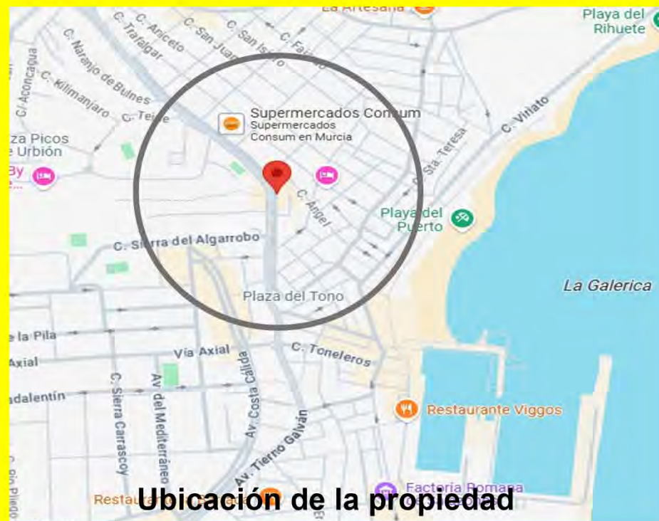
Ubicación de la propiedad

Precio : 99.000€ Impuestos no incluidos.